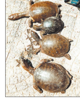
महामाया मंदिर के पास कलपेसरा तालाब में मिले कछुओं के शव

रतनपुर के महामाया नगरी में कछुए की मौत का मामला थमने का नाम नहीं ले रहा है। कुछ दिन पहले महामाया कुंड में 23 मृत कछुओं के मिलने संबंधी मामले की जांच अब तक पूरी नहीं हो पाई है, इधर मंगलवार की सुबह रतनपुर महामाया मंदिर के पहले बने कलपेसरा तालाब में फिर चार कछुओं का शव पाया गया। सूचना पर वन विभाग की कछुए रतनपुर की जांच शुरू कर दी है।