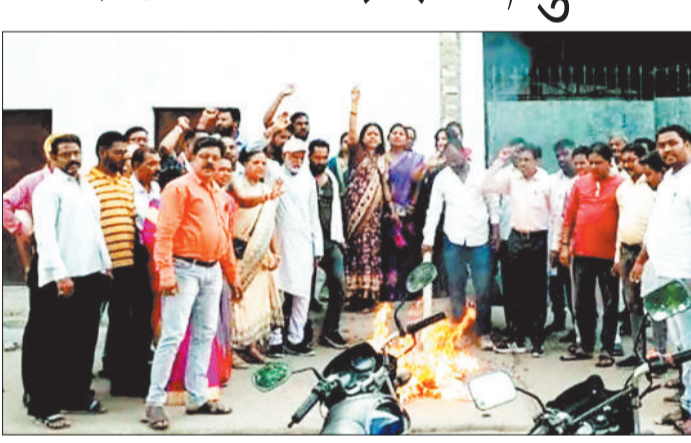
पुतला दहन करते कांग्रेस कार्यकर्ता।

हरिभूमि न्यूज ►► कोरबा जिला कांग्रेस कमेटी द्वारा दुर्ग में 6 वर्षीय मासूम बच्चों के साथ हुए दुराचार व हत्या तथा प्रदेश में महिलाओं के साथ लगातार हो रही अपराध की संवेदनशील घटनाओं को गंभीरता से लेते हुए पीड़ित परिवार को न्याय दिलाने व राज्य की लचर कानून व्यवस्था के कारण गृहमंत्री के इस्तीफे की मांग को लेकर मंगलवार को टीपी नगर स्थित कांग्रेस कार्यालय के सामने गृहमंत्री का पुतला दहन किया गया।