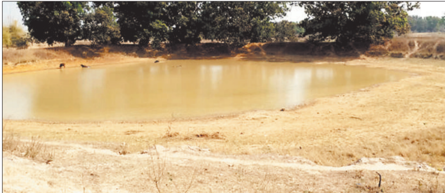
ग्रामीण अंचल की तालाबों का कम होने लगा जलस्तर।

कोरबा और पोड़ी उपरोड़ा ब्लाक में स्थिति ज्यादा खराब