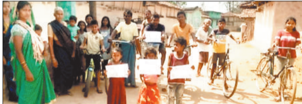
कोरबा