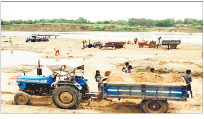
हरिभूमि न्यूज ►► कोरबा