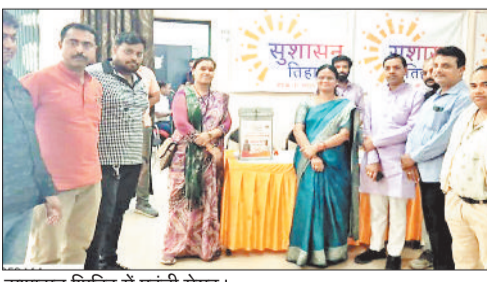
सुशासन शिविर में पहुंची मेयर।

प्रत्येक वाडों हेतु पृथक-पृथक काउंटर स्थापित कर वाडोंवार आवेदन लिए जा रहे हैं, महापौर, आयुक्त व सभापति ने प्रत्येक वाडोंवार स्थापित काउंटरों का निरीक्षण किया, प्राप्त आवेदनों की जानकारी ली, साथ ही आवेदन जमा कराने हेतु शिविर में पहुंचे नागरिकों से भेंट कर उनकी समस्या, शिकायत व मांग आदि के संबंध में चर्चा की, उनकी समस्याओं को जाना तथा आवेदन जमा कराकर क्रमबद्ध रूप से उनके निराकरण के संबंध में अधिकारियों को आवश्यक दिशा निर्देश दिए। आज आयोजित शिविरों के दौरान