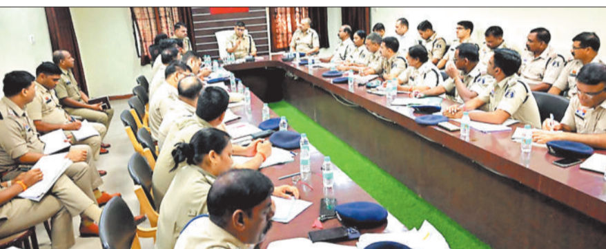
थाना प्रभारियों की बैठक लेते पुलिस अधीक्षक।